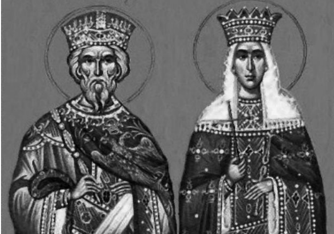
성 마르키아노스와 성 뿔헤리아